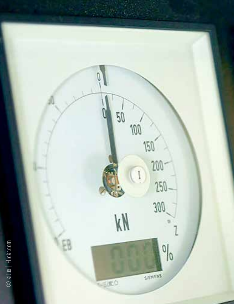
Ausgebremst – vom ungehinderten Waren- und Personenverkehr in der EU ist man auf der Eisenbahn noch weit entfernt.